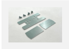
145-50200, F direkter Veebinder mit Abdeckung