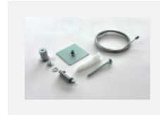
145-50302, N Seile 6000mm + Metallhalter;