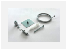
145-50300, N Seile 2000mm + Metallhalter;