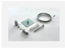
145-50301, N Seile 4000mm + Metallhalter;