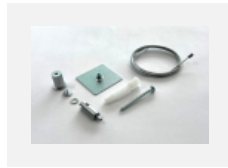
145-50302, N Seile 6000mm + Metallhalter;