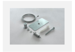
145-50303, N Seile an Profilverbindung 2000mm - 1 Stk. + Metallhalter