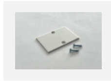
145-50101, S 2 x Metall-Endkappe mit Schrauben