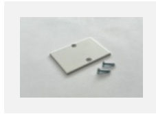
145-50101, B 2 x Metall-Endkappe mit Schrauben