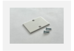
145-50101, W 2 x Metall-Endkappe mit Schrauben