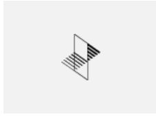
145-20700, B Wandhalter (2 Stk) Lina45