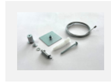
145-50300, N Seile 2000mm + Metallhalter;