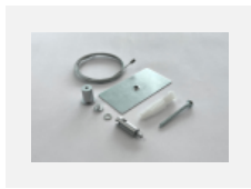
145-50304, N Seile an Profilverbindung 4000mm - 1 Stk. + Metallhalter