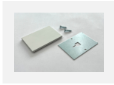
145-50102, B 2 x Metall-Endkappe ohne Schrauben