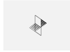
145-20700, W Wandhalter (2 Stk) Lina45