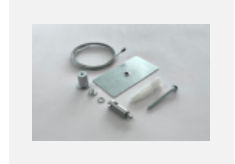
145-50303, N Seile an Profilverbindung 2000mm - 1 Stk. + Metallhalter