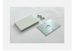
145-50102, S 2 x Metall-Endkappe ohne Schrauben