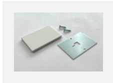
145-50102, B 2 x Metall-Endkappe ohne Schrauben