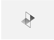
145-20700, B Wandhalter (2 Stk) Lina45