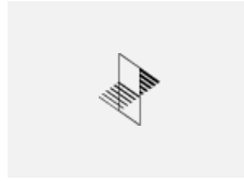
145-20700, S Wandhalter (2 Stk) Lina45