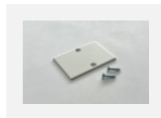
145-50101, B 2 x Metall-Endkappe mit Schrauben