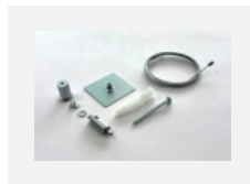
145-50300, N Seile 2000mm + Metallhalter;