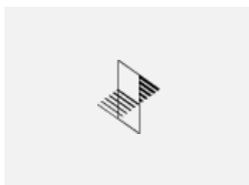
145-20700, S Wandhalter (2 Stk) Lina45