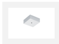
00-00370, S Deckenkappe 80x80x32mm