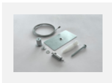
145-50305, N Seile an Profilverbindung 6000mm - 1 Stk. + Metallhalter