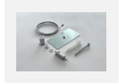
145-50303, N Seile an Profilverbindung 2000mm - 1 Stk. + Metallhalter