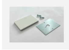
145-50102, B 2 x Metall-Endkappe ohne Schrauben