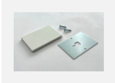
145-50102, W 2 x Metall-Endkappe ohne Schrauben