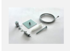
145-50300, N Seile 2000mm + Metallhalter;