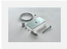
145-50305, N Seile an Profilverbindung 6000mm - 1 Stk. + Metallhalter