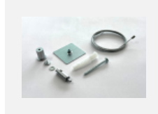
145-50302, N Seile 6000mm + Metallhalter;