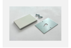
145-50102, S 2 x Metall-Endkappe ohne Schrauben