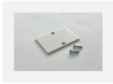
145-50101, W 2 x Metall-Endkappe mit Schrauben