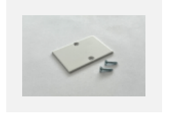
145-50101, B 2 x Metall-Endkappe mit Schrauben