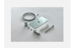
145-50303, N Seile an Profilverbindung 2000mm - 1 Stk. + Metallhalter