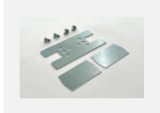
145-50200, F direkter Veerbinder mit Abdeckung