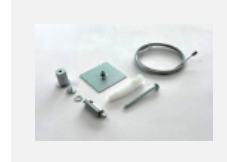
145-50302, N Seile 6000mm + Metallhalter;