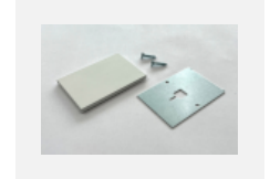
145-50102, S 2 x Metall-Endkappe ohne Schrauben