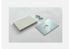
145-50102, W 2 x Metall-Endkappe ohne Schrauben