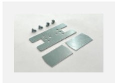
145-50200, F direkter Veerbinder mit Abdeckung