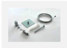
145-50300, N Seile 2000mm + Metallhalter;