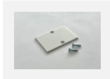
145-50101, W 2 x Metall-Endkappe mit Schrauben