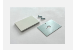
145-50102, S 2 x Metall-Endkappe ohne Schrauben