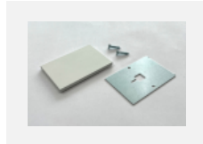
145-50102, B 2 x Metall-Endkappe ohne Schrauben