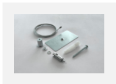
145-50305, N Seile an Profilverbindung 6000mm - 1 Stk. + Metallhalter