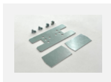
145-50200, F direkter Veerbinder mit Abdeckung