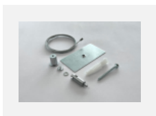
145-50304, N Seile an Profilverbindung 4000mm - 1 Stk. + Metallhalter