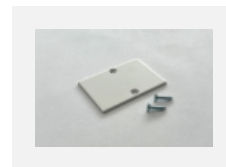
145-50101, B 2 x Metall-Endkappe mit Schrauben