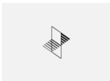
145-20700, B Wandhalter (2 Stk) Lina45