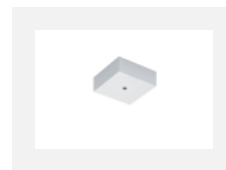
00-00370, S Deckenkappe 80x80x32mm