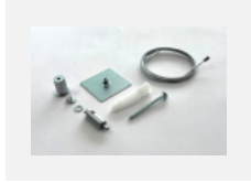
145-50300, N Seile 2000mm + Metallhalter;