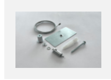
145-50303, N Seile an Profilverbindung 2000mm - 1 Stk. + Metallhalter