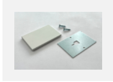
145-50102, W 2 x Metall-Endkappe ohne Schrauben