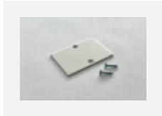
145-50101, S 2 x Metall-Endkappe mit Schrauben