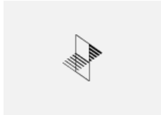
145-01200, F Zubehör für Demontage El. Modules für Lina145