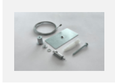
145-50303, N Seile an Profilverbindung 2000mm - 1 Stk. + Metallhalter