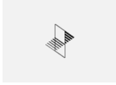
145-01200, F Zubehör für Demontage El. Modules für Lina145