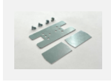
145-50200, F direkter Veerbinder mit Abdeckung