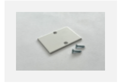
145-50101, B 2 x Metall-Endkappe mit Schrauben