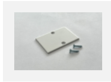
145-50101, B 2 x Metall-Endkappe mit Schrauben