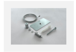
145-50303, N Seile an Profilverbindung 2000mm - 1 Stk. + Metallhalter