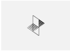
145-20700, W Wandhalter (2 Stk) Lina45