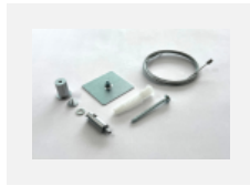
145-50301, N Seile 4000mm + Metallhalter;