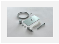
145-50304, N Seile an Profilverbindung 4000mm - 1 Stk. + Metallhalter