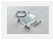
145-50305, N Seile an Profilverbindung 6000mm - 1 Stk. + Metallhalter