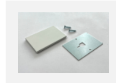
145-50102, B 2 x Metall-Endkappe ohne Schrauben