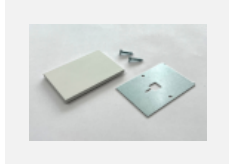
145-50102, W 2 x Metall-Endkappe ohne Schrauben