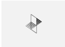
145-20700, W Wandhalter (2 Stk) Lina45