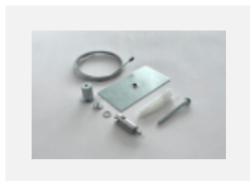
145-50304, N Seile an Profilverbindung 4000mm - 1 Stk. + Metallhalter