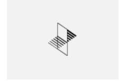
145-01200, F Zubehör für Demontage El. Modules für Lina145