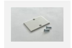
145-50101, W 2 x Metall-Endkappe mit Schrauben