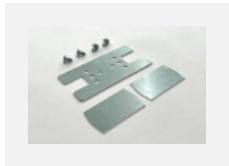
145-50200, F direkter Veerbinder mit Abdeckung