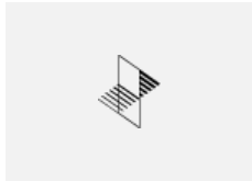
145-20700, B Wandhalter (2 Stk) Lina45