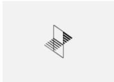
145-20700, S Wandhalter (2 Stk) Lina45