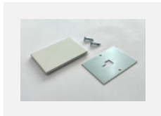
145-50102, W 2 x Metall-Endkappe ohne Schrauben