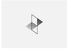
145-20700, B Wandhalter (2 Stk) Lina45