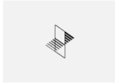
145-20700, S Wandhalter (2 Stk) Lina45