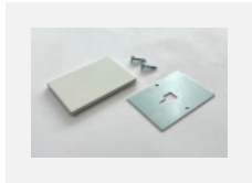
145-50102, B 2 x Metall-Endkappe ohne Schrauben