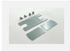
145-50200, F direkter Veerbinder mit Abdeckung