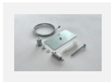
145-50305, N Seile an Profilverbindung 6000mm - 1 Stk. + Metallhalter