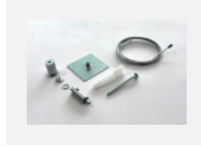
145-50301, N Seile 4000mm + Metallhalter;