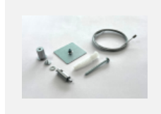
145-50302, N Seile 6000mm + Metallhalter;