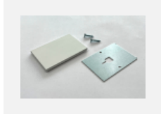
145-50102, W 2 x Metall-Endkappe ohne Schrauben