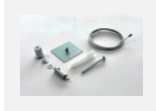
145-50301, N Seile 4000mm + Metallhalter;