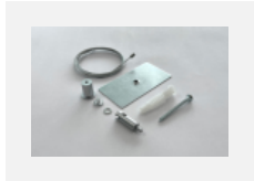
145-50305, N Seile an Profilverbindung 6000mm - 1 Stk. + Metallhalter