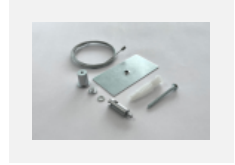
145-50303, N Seile an Profilverbindung 2000mm - 1 Stk. + Metallhalter