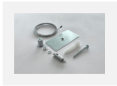
145-50305, N Seile an Profilverbindung 6000mm - 1 Stk. + Metallhalter