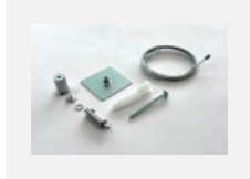
145-50300, N Seile 2000mm + Metallhalter;