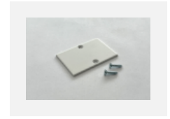
145-50101, B 2 x Metall-Endkappe mit Schrauben