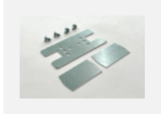
145-50200, F direkter Veebinder mit Abdeckung