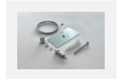
145-50303, N Seile an Profilverbindung 2000mm - 1 Stk. + Metallhalter