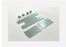
145-50200, F direkter Veebinder mit Abdeckung