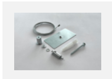
145-50304, N Seile an Profilverbindung 4000mm - 1 Stk. + Metallhalter