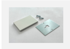
145-50102, W 2 x Metall-Endkappe ohne Schrauben