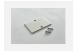
145-50101, S 2 x Metall-Endkappe mit Schrauben