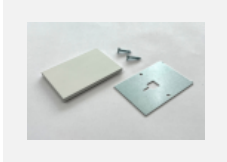
145-50102, S 2 x Metall-Endkappe ohne Schrauben