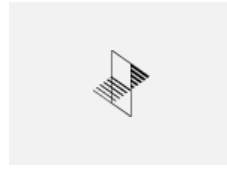
145-01200, F Zubehör für Demontage El. Modules für Lina145