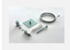
145-50301, N Seile 4000mm + Metallhalter;