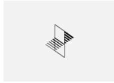
145-20700, W Wandhalter (2 Stk) Lina45