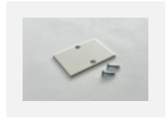
145-50101, W 2 x Metall-Endkappe mit Schrauben