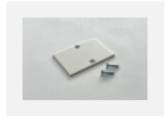
145-50101, S 2 x Metall-Endkappe mit Schrauben