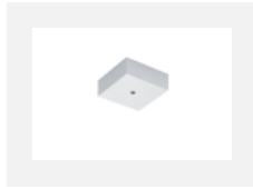
00-00370, W Deckenkappe 80x80x32mm