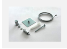
145-50301, N Seile 4000mm + Metallhalter;