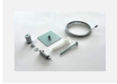
145-50300, N Seile 2000mm + Metallhalter;