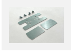
145-50200, F direkter Veebinder mit Abdeckung