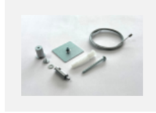
145-50302, N Seile 6000mm + Metallhalter;