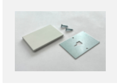
145-50102, W 2 x Metall-Endkappe ohne Schrauben