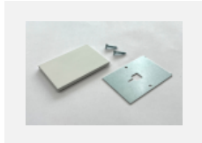
145-50102, S 2 x Metall-Endkappe ohne Schrauben