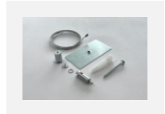
145-50303, N Seile an Profilverbindung 2000mm - 1 Stk. + Metallhalter