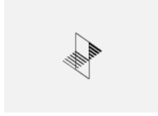
145-20700, S Wandhalter (2 Stk) Lina45