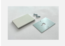
145-50102, W 2 x Metall-Endkappe ohne Schrauben