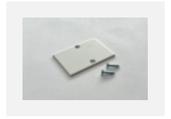
145-50101, W 2 x Metall-Endkappe mit Schrauben