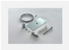
145-50304, N Seile an Profilverbindung 4000mm - 1 Stk. + Metallhalter