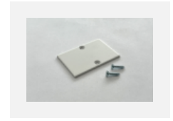
145-50101, W 2 x Metall-Endkappe mit Schrauben