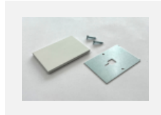
145-50102, B 2 x Metall-Endkappe ohne Schrauben