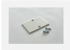
145-50101, B 2 x Metall-Endkappe mit Schrauben