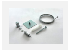
145-50302, N Seile 6000mm + Metallhalter;