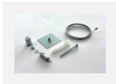
145-50300, N Seile 2000mm + Metallhalter;