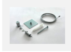
145-50302, N Seile 6000mm + Metallhalter;