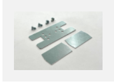
145-50200, F direkter Veerbinder mit Abdeckung