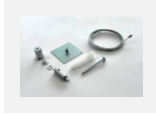
145-50301, N Seile 4000mm + Metallhalter;