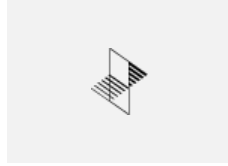
145-20700, B Wandhalter (2 Stk) Lina45