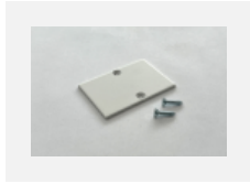
145-50101, S 2 x Metall-Endkappe mit Schrauben