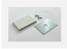
145-50102, S 2 x Metall-Endkappe ohne Schrauben