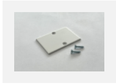
145-50101, B 2 x Metall-Endkappe mit Schrauben