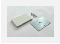
145-50102, B 2 x Metall-Endkappe ohne Schrauben