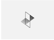
145-20700, B Wandhalter (2 Stk) Lina45