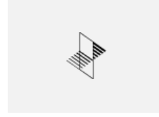
145-20700, S Wandhalter (2 Stk) Lina45