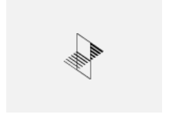
145-01200, F Zubehör für Demontage El. Modules für Lina145