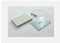
145-50102, S 2 x Metall-Endkappe ohne Schrauben