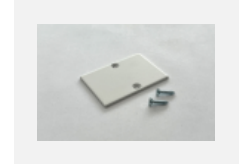
145-50101, S 2 x Metall-Endkappe mit Schrauben