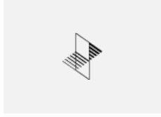
145-20700, S Wandhalter (2 Stk) Lina45