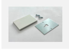
145-50102, S 2 x Metall-Endkappe ohne Schrauben